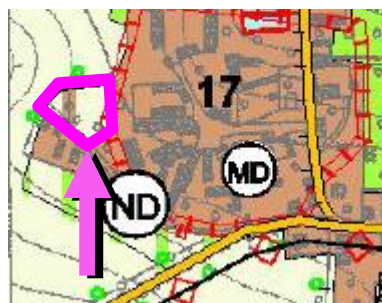
Abb. 1: Darstellungen des rechtskräftigen Flächennutzungsplanes und parallele Änderungen im Zuge des Vorhabens

Die gekennzeichnete Mischbaufläche im OT Krostitz soll in Wohnbaufläche umgewandelt werden.